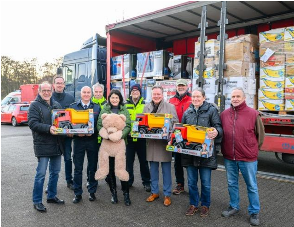
Kurz vor der Abfahrt des 22. Hilfstransportes am 15.12.2025

Hier war die Beladung so gut wie abgeschlossen und der LKW machte sich noch am gleichen Tage auf die lange Reise in unsere Partnerstadt. 15 km Stau an der polnisch-ukrainischen Grenze verzögerten die Ankunft dann doch sehr. Aber am Ende ist es dem Fahrer gelungen, den LKW wohlbehalten noch vor Weihnachten mit seiner wichtigen Fracht ans Ziel zu bringen.