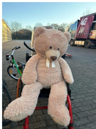
Was wären wir nur ohne unsere Feuerwehr?