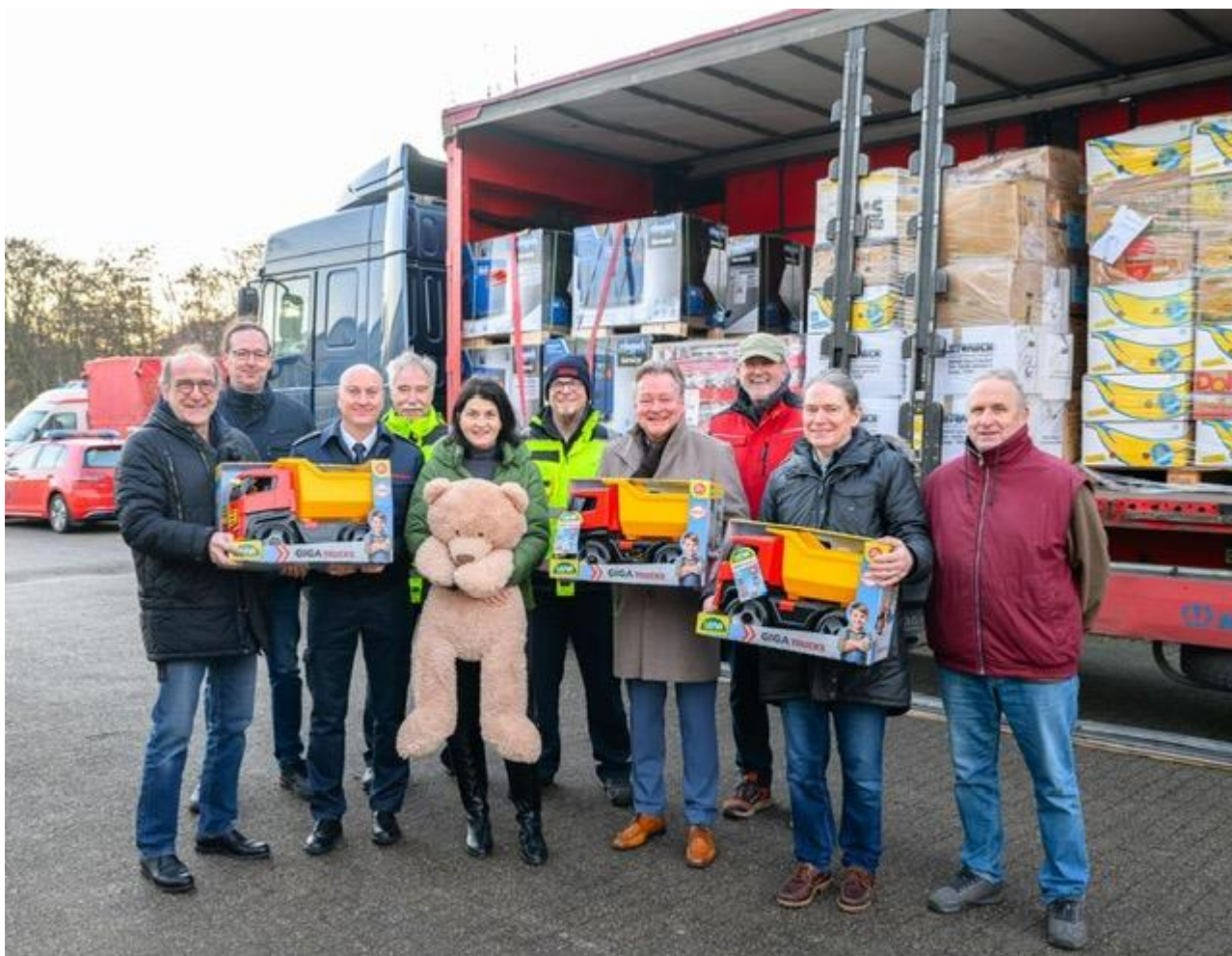
Kurz vor der Abfahrt des 22. Hilfstransportes am 15.12.2025